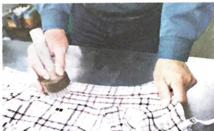
襟や袖の汚れは歯ブラシなどを使って予洗りする