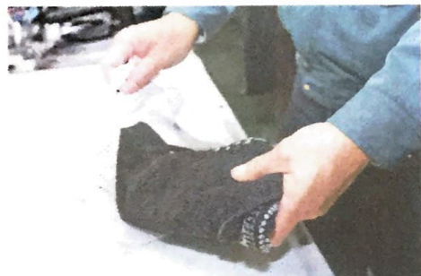
おしゃれ着や女性用下着はネットに入れる